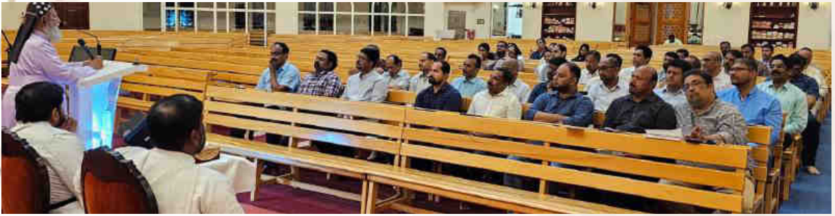
Family Prayer 1st Day