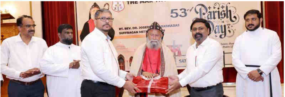
Merit Award Winners